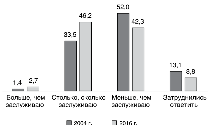
Рис. 1. Мнения занятого населения о получении заслуженной доли благ (в % от общего количества опрошенных).