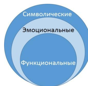
Рис. 2. Маркетинговая модель «Товарная луковица»

расслоение в соответствии с известной маркетинговой моделью «Товарная вища», представленной на рис. 2.