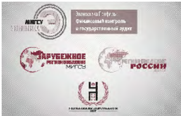
Рисунок 2. Образовательные программы Российской академии народного хозяйства и государственной службы при Президенте Российской Федерации, формирующие управленческие компетенции

в формировании профессиональных компетенций специалистов в сфере государственного администрирования.