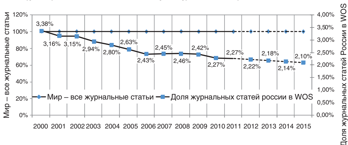
Рис. 1. Доля журнальных статей России в системе «Web of Science» по отношению к общемировому массиву за период 2000–2011 гг. и прогноз на период 2012–2015 гг.

Примечание. Курсивом указаны доли полного несовпадения прогнозируемых значений публикаций России в WoS по годам.