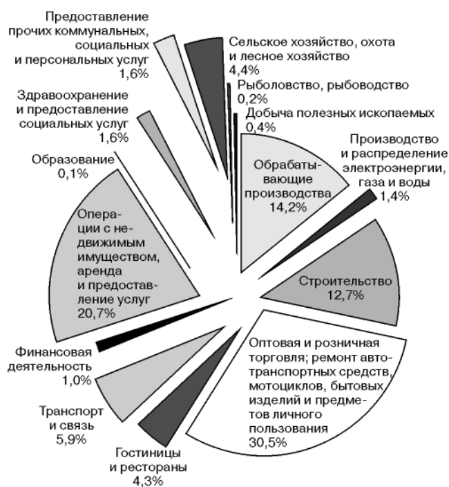
Рис. 1. Распределение числа действующих малых предприятий (без микропредприятий) по видам экономической деятельности, 2010 г.

В настоящее время зарубежные исследователи пришли к выводу о том, что значительная часть инноваций в секторе услуг не охватывается должным образом концепцией технологических продуктовых и процессных инноваций. Как отмечается в Руководстве Осло, «представления о том, что есть инновация, сейчас расширились, включив два новых типа: