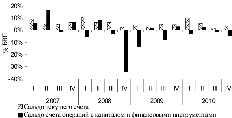
Сальдо текущего счета и счета операций с капиталом и финансовыми инструментами в 2007–2010 гг. (% ВВП).